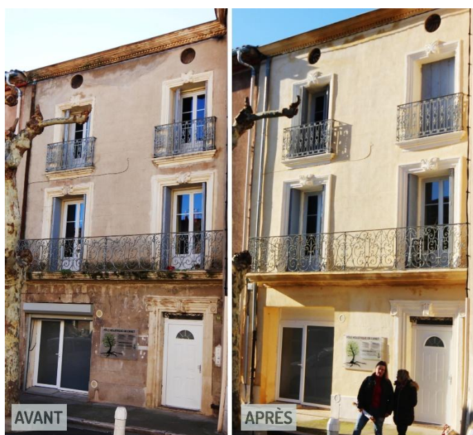
Bâtiment ayant bénéficié du Plan Rénovation Façades à Canet